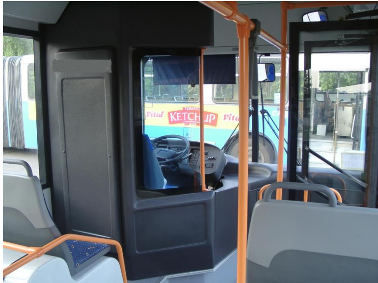
Сл. 1 Пример захтеване возачке кабине

Брава за отварање, затварање и забрављивање врата у затвореном положају треба да се налази са унутрашње стране врата - до возача.