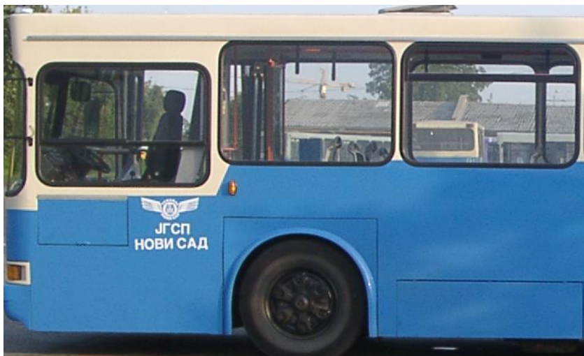
Сл. 3 Оквирни приказ захтеваног лакирања