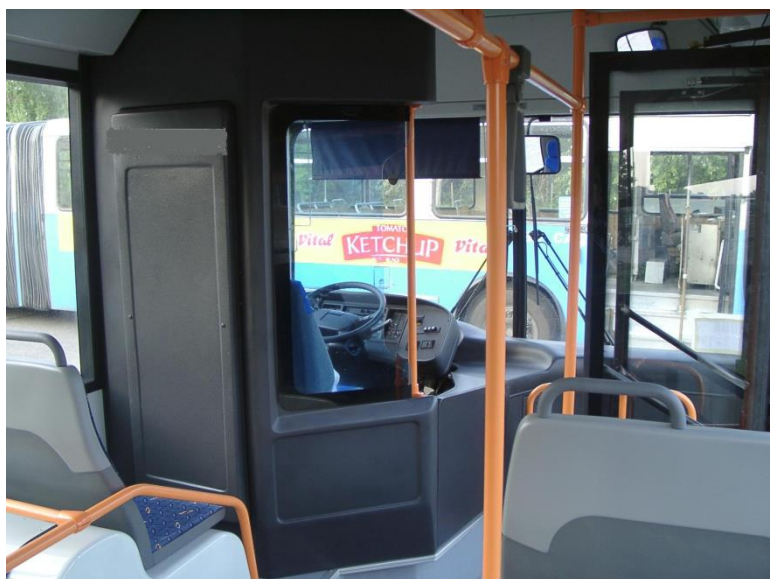
Сл. 1 Пример захтеване возачке кабине

Брава за отварање, затварање и забрављивање врата у затвореном положају треба да се налази са унутрашње стране врата - до возача.