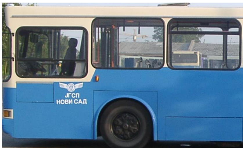
Сл. 3 Оквирни приказ захтеваног лакирања

Прелиминарно, завршно лакирање доњег дела оплате потребно је извршити са лаком RAL-5015, а горњег дела са лаком RAL-1015 (граница горњег и доњег дела оплате је доња ивица бочних стакала, Слика 3).